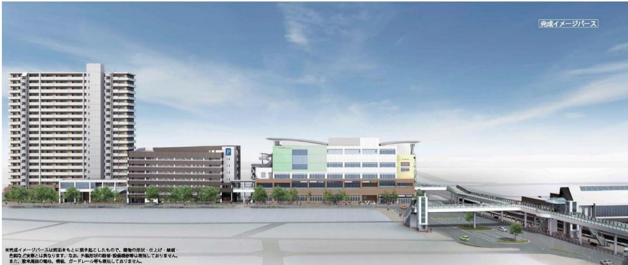
※完成イメージバスは概観をもとに描き起こしたもので、建築物の形状・仕上げ・緑化・色調などは異なります。なお、外観写真の撮影・投稿権利は開発しております。また、駅周辺の建屋、橋脚、ガードレール等も概観しておりません。

JR 阪和線、和泉府中駅前の再開発事例です。若江岩田とよく似た施設構成です。駐車場の入口も、入居者用と一般利用者用に分かれています。