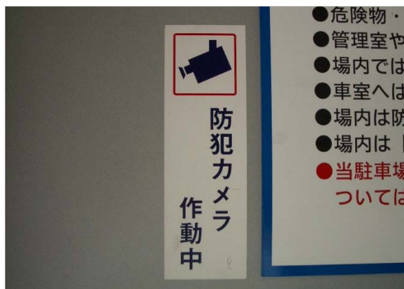
【注意喚起のサイン】