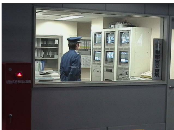
【管理室内モニター設置例】