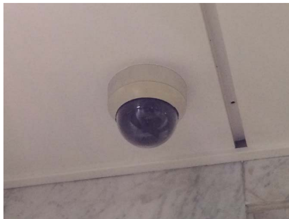
【防犯カメラ(ドーム型)】