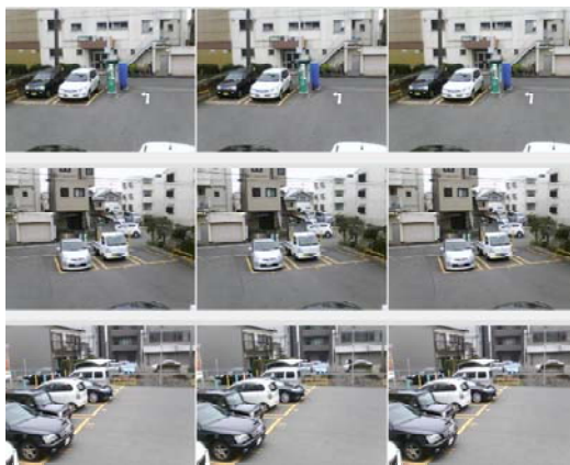
【遠隔モニター画面(静止画表示の例)】