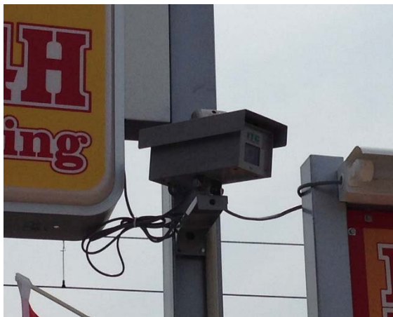
【防犯カメラ(カメラ型)】